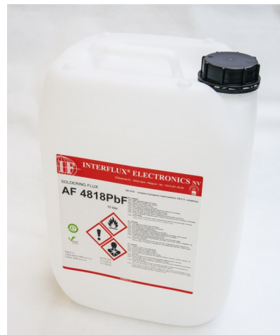
Abgebildetes Produkt kann vom gelieferten Produkt abweichen

Generell soll es das Ziel sein, das Minimum aufzutragen, so dass die Rückstände nach dem Löten mini-