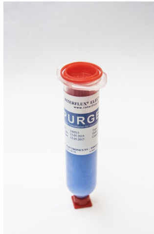
La photo n'est pas contractuelle

Interflux® Purgel a été développé pour purger, nettoyer et maintenir le mécanisme des doseurs, des pompes et des systèmes de jet propres. Le Purgel évite le démontage complet du doseur. Il protège les parties du mécanisme du doseur pour un long stockage et le maintient propre pour les prochaines opérations.