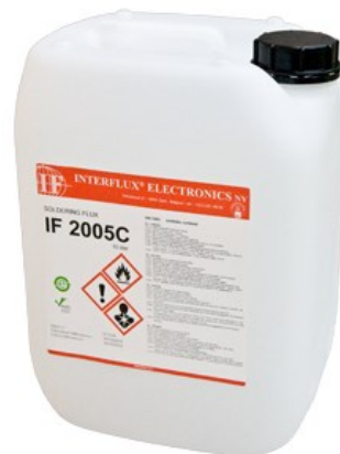
La photo n'est pas contractuelle

Le flux est classé dans les normes IPC et EN comme OR/L0.