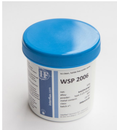
La photo n'est pas contractuelle

La crème est classée OR MO suivant les normes IPC et EN.